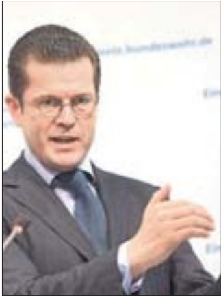
Original Carl Theodor zu Guttenberg