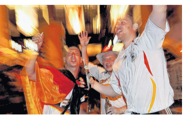
Wie 2006: Deutschland in schwarz-rot-gold.

Wir jubeln alles weg – beim 4:0-Auftaktzieg hat das ja schon mal ganz gut geklappt. Wenn Sie Bilder haben, wie Sie Jogis Jungs die Daumen drücken, dann nichts wie her damit – der Jubel muss in die Zeitung. Unsere Mail-Adresse: red.kitzingen@mainpost.de